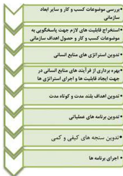
(نمودار شماره ۱)

جهت استفاده از این مکانیزم می بایستی به سه سؤال اصلی به شرح ذیل پاسخ دهیم: